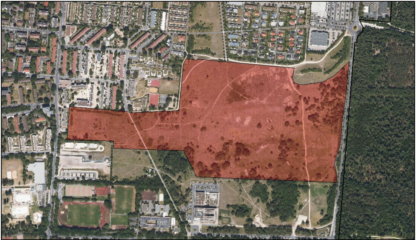
Neuabgrenzung NSG Exerzierplatz, Stadt Erlangen Maßstab M 1 : 5.000