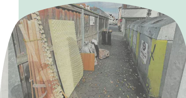
An den Containern am Behälterplatz in Erlangen wird nicht nur Glasmüll entsorgt.

Die Vermüllung der Stadt ist kein schöner Anblick; es schadet der Umwelt und bedeutet einen hohen finanziellen wie auch personellen Aufwand die Ablagerungen zu entfernen. Diese Kosten müssen letztlich alle Bürgerinnen und Bürger tragen.